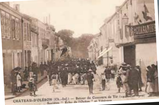
Rue Georges Clemenceau