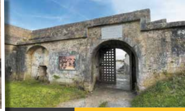
La porte des pêcheurs